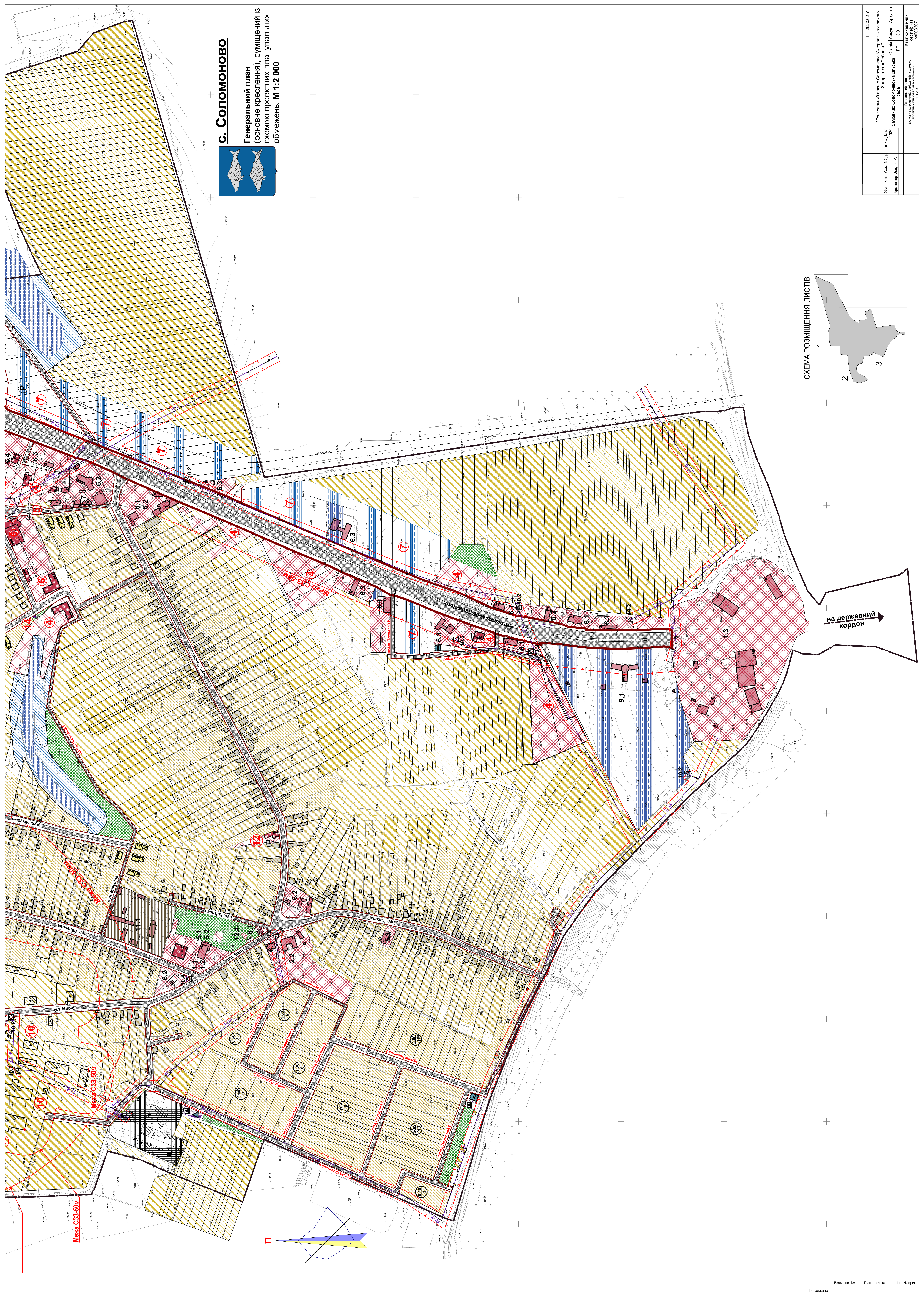
СХЕМА РОЗМІЩЕННЯ ЛІСТІВ

Генеральний план (основне креслення), суміщений із схемою проектних планувальних обмежень, М 1:2 000